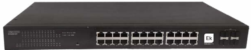
SWG 24 L2