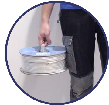
POIGNEE SUR LA BOBINE EK ROLLER