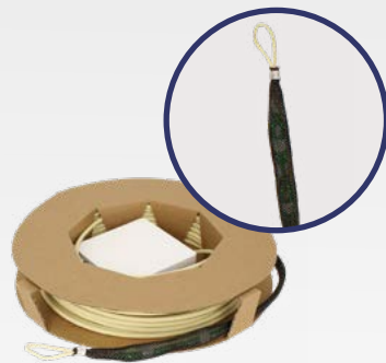
PFR XX DEK