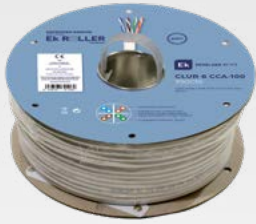
CLUR 6 CCA-100