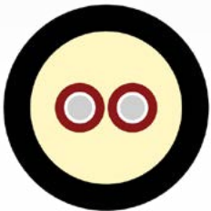
CFOR 2 900N