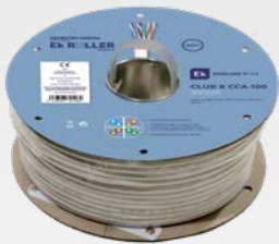
CLUR 6 CCA-100

CABLES DE DATOS Cat-6A COMPATIBLES EK ROLLER