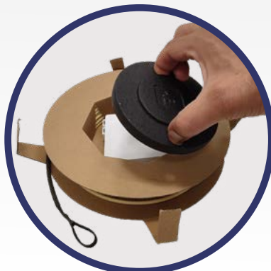
Ek ROLLER + con accesorio especial para facilitar el desenrollado