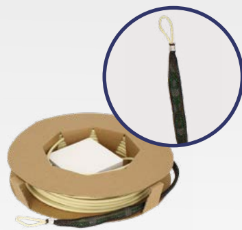
PFR XX DEK

PAUS - KITS LATIGUILLOS CONECTORIZADOS / CPR Dca COMPATIBLES CON EK ROLLER