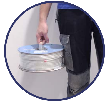
ASA BOBINA EK ROLLER