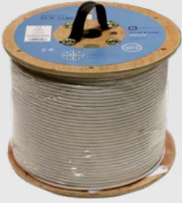
CLUR 6 CUD