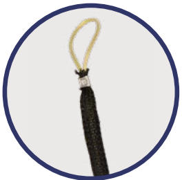
Detalle del sistema de tracción