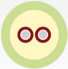
CFOR 2 900-D