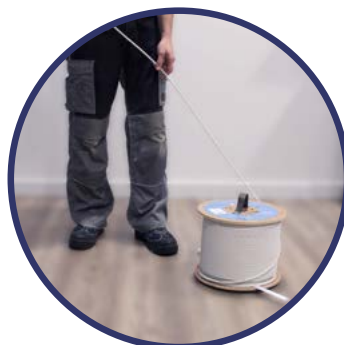
DESENROLLADO BOBINA EK ROLLER