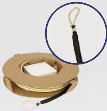
PFR XX DT