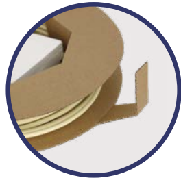
Aletas integradas en la bobina