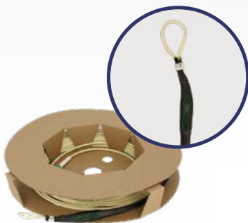
PCR XX FEK

PATCH CORDS CON CONECTORES FLEXIBLES / BAT FIBRA / CPR Dca EK ROLLER