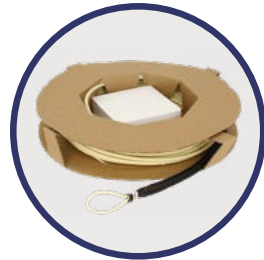
Bobina de cartón con sistema Ek ROLLER