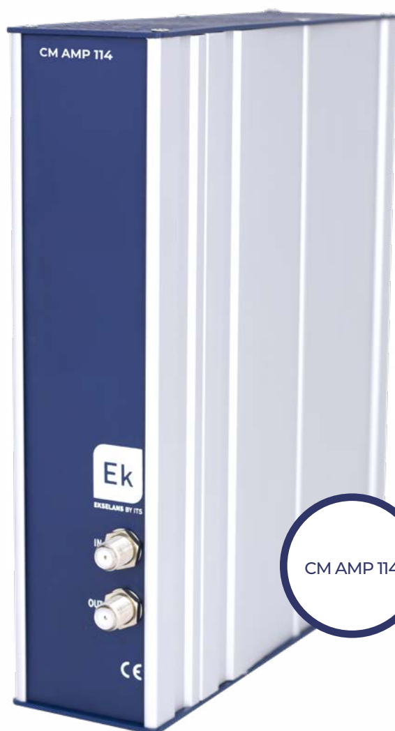
CM AMP 114