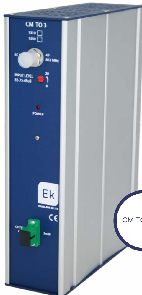
CM TO3 1310