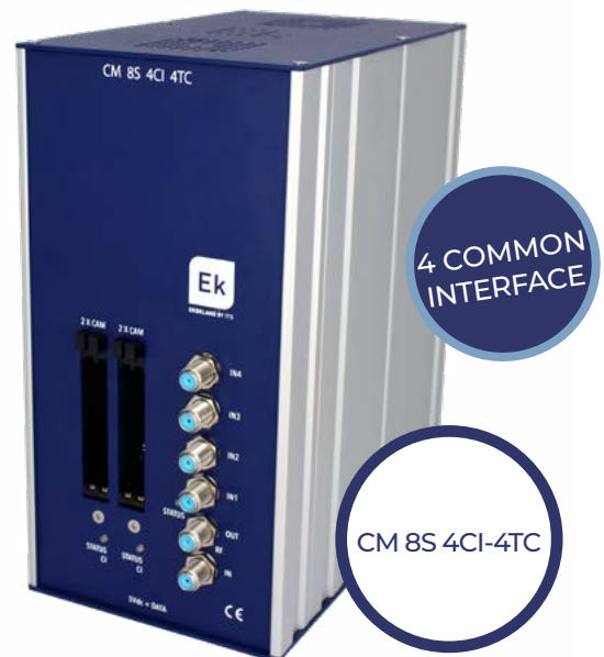
CM 8S 4CI-4TC