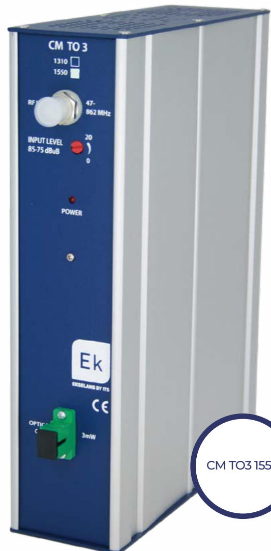
CM TO3 1550