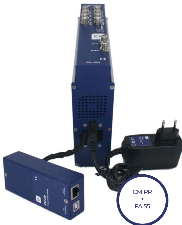
CM PR + FA 55