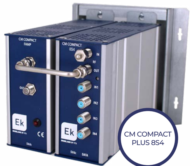
CM COMPACT PLUS 8S4