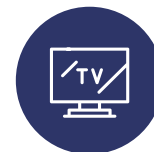
CATV / HFC